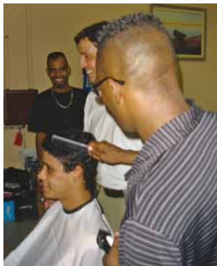
Alunos do curso de cabeleireiro com o então secretário de Assistência e Desenvolvimento Social, Floriano Pesaro

No dia 28 de março, os organizadores do Projeto Nós do Centro realizaram a I Mostra de Trabalhos de Inclusão Social, onde os alunos puderam apresentar o que aprenderam durante os módulos. Expondo um bom exemplo do aprendizado, o local do evento foi montado, decorado e iluminado pelos alunos dos cursos técnicos em espetáculo.