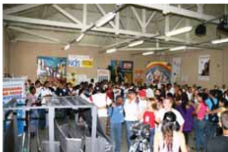
I Mostra Nós do Centro

A integração social dos excluídos na economia mundial e a redução da pobreza são os objetivos do projeto, que tem a parceria de diversas empresas privadas, que oferecem capacitação profissional para jovens e adultos. São oferecidos cursos nas áreas de construção civil e também cursos socioculturais. Ao término de cada módulo, os alunos são certificados e já podem atuar nas áreas escolhidas. Entre as matérias que são ensinadas estão: estética, cabeleireiro, manicure e pedicure, maquiagem, telemarketing, restaurante, dentre outras.