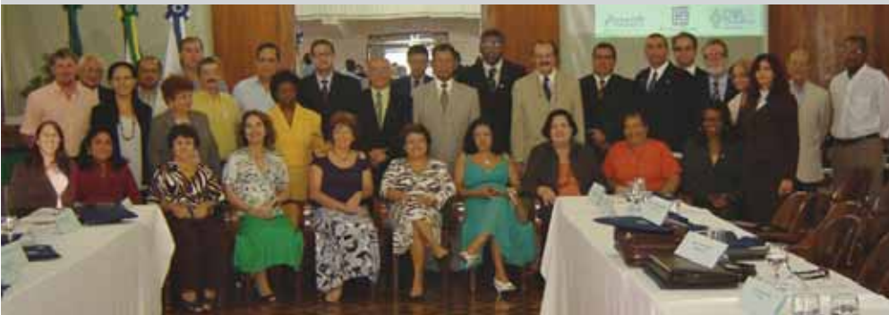
Presidentes e diretores dos Sindicatos