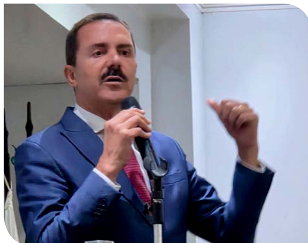
Deputado Itamar Borges

O deputado estadual, Itamar Borges abriu os pronunciamentos, anunciando a próxima sessão solene em comemoração ao dia do Profissional da Contabilidade, que será em 4 de maio, na Assembleia Legislativa do Estado de São Paulo-Alesp. "Saibam que eu me sinto um profissional da Contabilidade de fato, aprendi a respeitar, a enxergar e a reconhecer os profissionais da Contabilidade. Ainda mais diante dos desafios que têm pela frente, como as novas regulamentações da reforma tributária. Parabéns pela data e contem sempre com a nossa parceria".